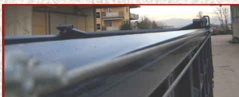
FUNI RIBASSATE SOTTO FILO SPONDA

ANDREOLI RIMORCHI SRL installa Elettta, un nuovo sistema di copertura innovativo, alla avanguardia, sicuro e pratico.