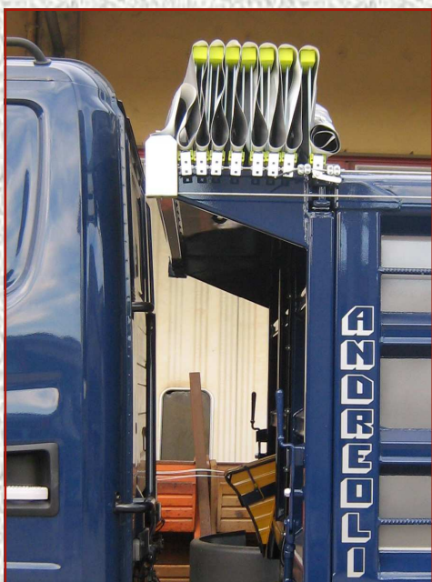
IMPACCHETTAMENTO RIGIDO ED ORDINATO