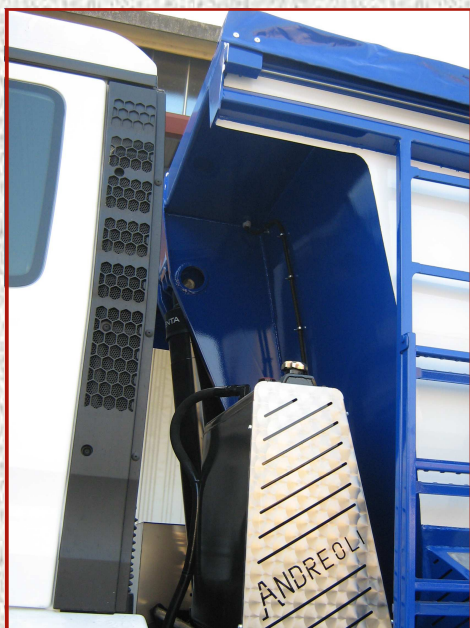
NIENTE PIU' INGOMBRI SULLA SPONDA ANTERIORE